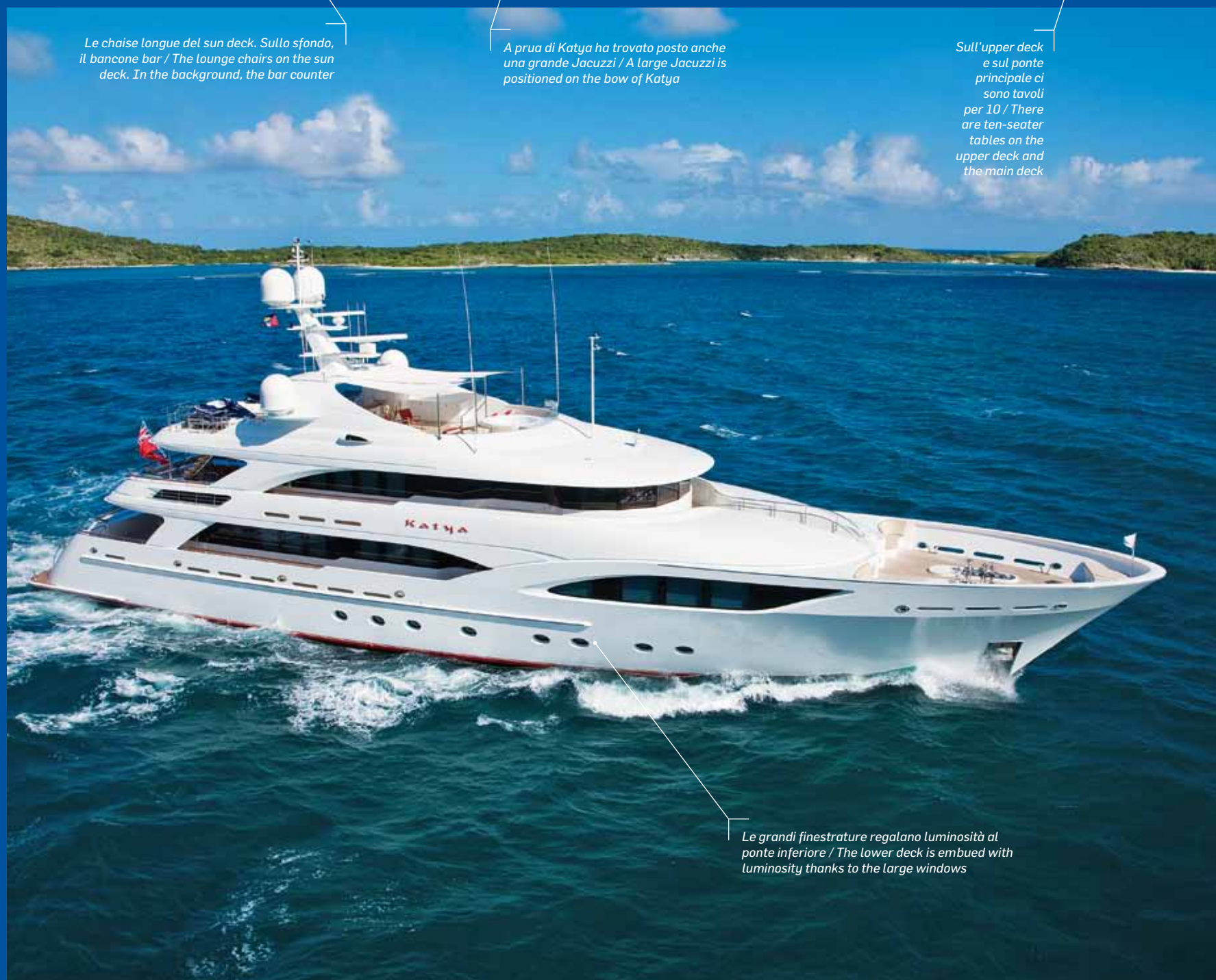
Le grandi finestre regalano luminosità al ponte inferiore / The lower deck is imbued with luminosity thanks to the large windows