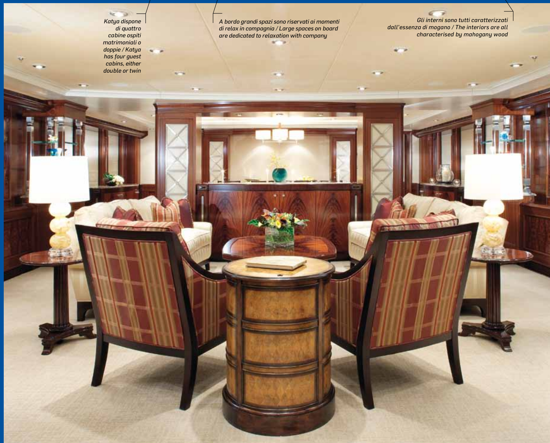
Gli interni sono tutti caratterizzati dall'essenza di mogano / The interiors are all characterised by mahogany wood