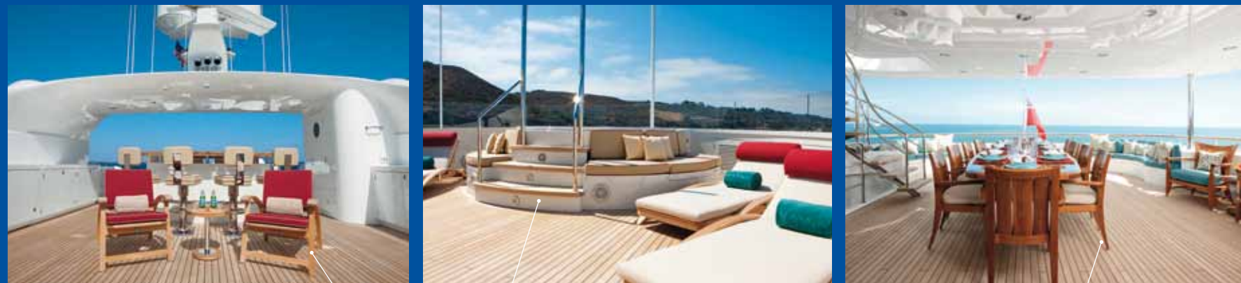
Le chaise longue del sun deck. Sullo sfondo, il bancone bar / The lounge chairs on the sun deck. In the background, the bar counter