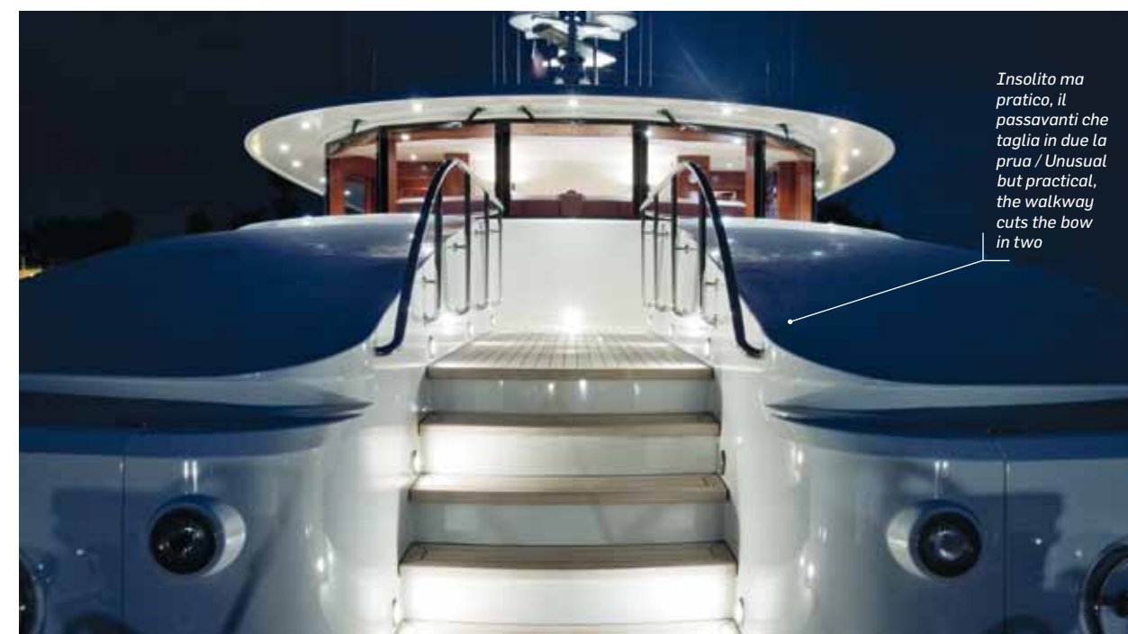
Insolito ma pratico, il passavanti che taglia in due la prua / Unusual but practical, the walkway cuts the bow in two

itself the challenge of building the finest luxury yachts on the market. This daring move proved so successful that by the 1990s its entire production was devoted to megayachts. Katya is, of course, just the latest example of the kind of superb quality Delta has achieved in the course of its long and honourable career. At 46 metres in length and 9.3 metres in the beam, Katya is the yard's first full-displacement megayacht and is both Lloyd's and MCA classed. She was designed by the Delta Design Group which not only styled the