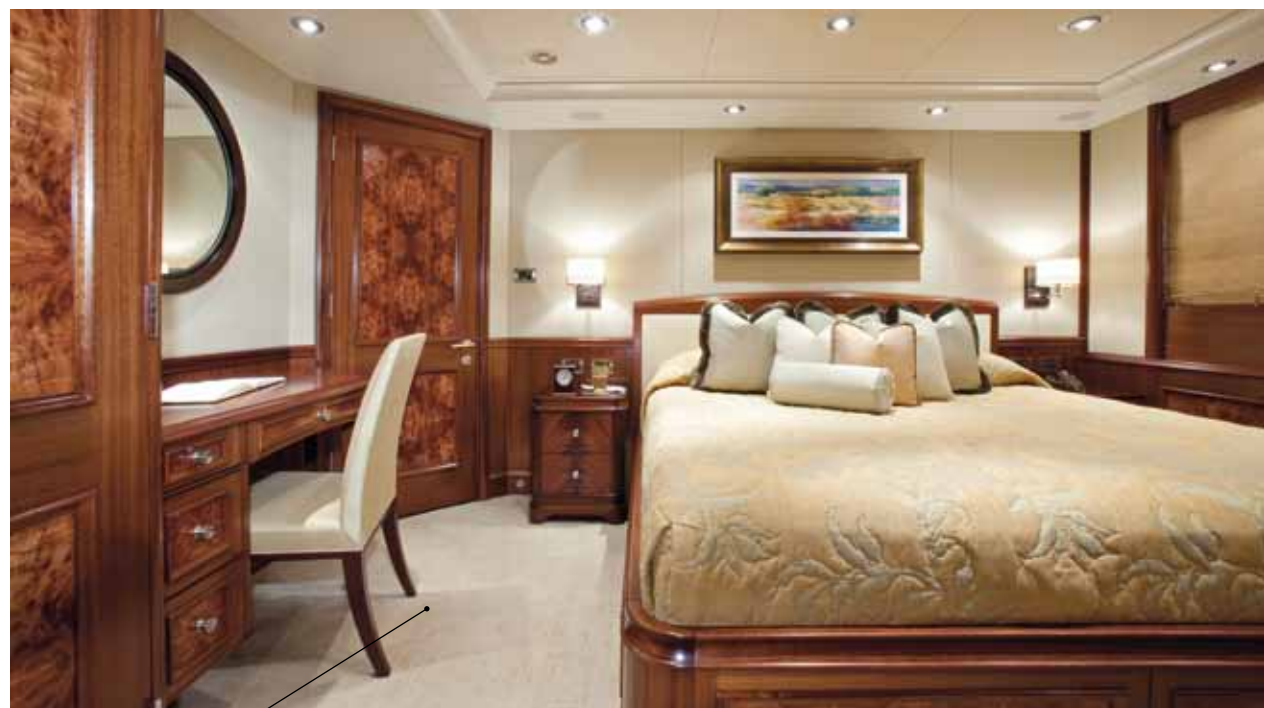
La cabina armatoriale ha due bagni / The owner's cabin has two bathrooms

stabilisers, which ensure the latter). Designer Jean Claude Canestrelli worked with the Delta Design Group to create a craft in which large outdoor areas and warm, welcoming but never overwhelming interiors create a fascinating mix. The sun deck includes a bar with a central island under the roll bar, a position for a galley unit, a hot tub and numerous lounge chairs. The cockpit on the main deck and the terrace on the upper deck are all devoted to al fresco living and both have 10-seater tables, making them genuine al fresco dining rooms.